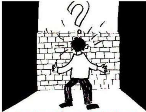
1. Un obstacle restreint la liberté.