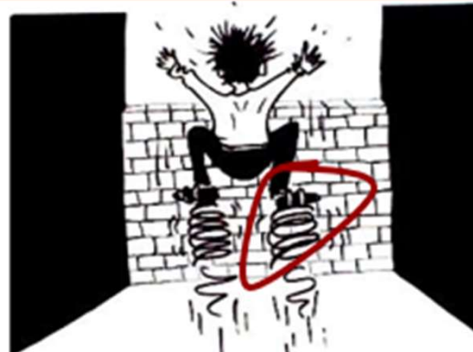
2. La personne utilise une aide technique pour franchir l'obstacle.