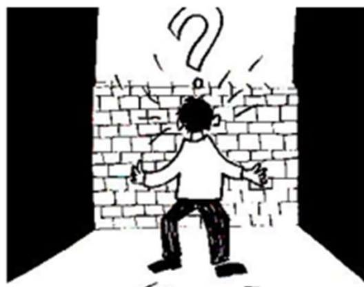
1. Un obstacle restreint la liberté.