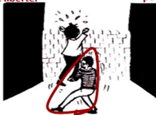
3. La personne recourt à une aide humaine pour franchir l'obstacle