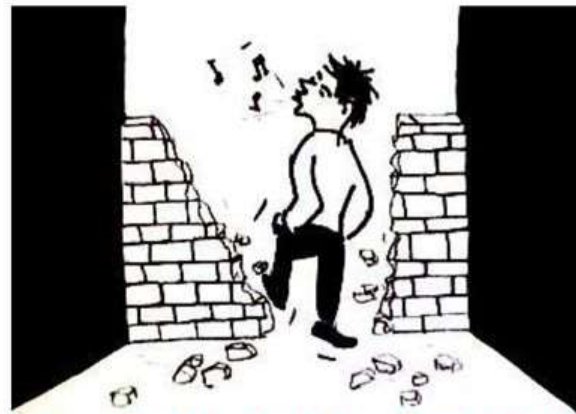
3. L'accessibilité rétablit la liberté et l'égalité.